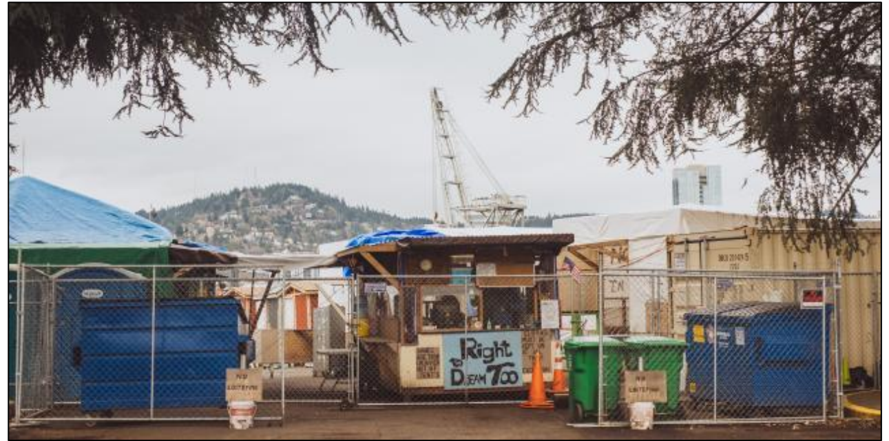
Right to Dream Too