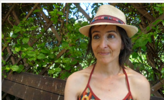
Léna : « Cultiver la ville : le « bonheur des dames » ? »